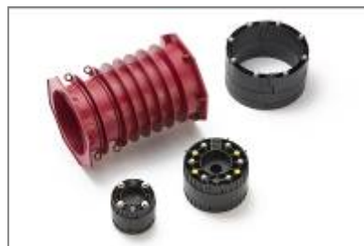
POLO-RDS evolution Dichtelemente und PP-Lamellenrohr