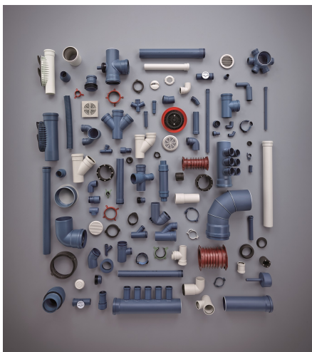
gesamtes System POLO-KAL®

POLO-KAL® ist nicht einfach ein Hausabflussrohr, sondern ein gesamtes System mit unzähligen präzise aufeinander abgestimmten und millionenfach bewährten Komponenten. Die somit einfache und schnelle Verarbeitung sowie Sicherheit bei der Montage unterstreicht die hohe Professionalität Ihrer Arbeit.