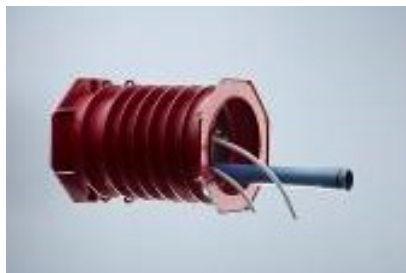
POLO-RDS evolution Rohr- und Kabeldurchführungssystem

Der patentierte, elastische Bereich am Lamellenrohr kompensiert Ungenauigkeiten und Schalungstoleranzen.