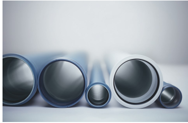
POLO-KAL XS, POLO-KAL NG und POLO-KAL 3S