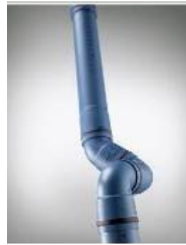
POLO-KAL XS Steckverbindung